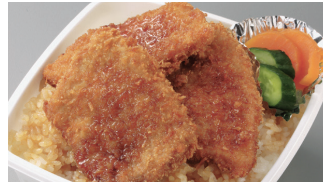
特製二段盛かつ丼